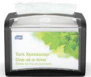
272611 Tork Xpressnap® Serviettdispenser Bord

Tork-løsninger sørger for beste praksis for renslighet og komfort på travle områder.