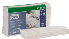
530178 Tork Heavy-Duty puhastuslapp

Kuidas me saame veel aidata? Võtke meiega ühendust, et rääkida teie ettevõttest.