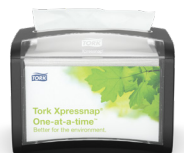
272611 Tork Xpressnap® lauapealne salvrätijaotur

Tork lahendused tagavad kõige paremad puhastustavad ja mugavuse nendes käidavates kogunemiskohtades.