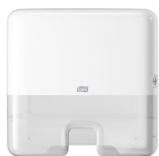
552100 Tork Xpress® Multifold Mini käterätijaotur

Tork kasutajasõbralikud süsteemid muudavad ristsaastumise ennetamise lihtsaks, parandades samal ajal mainet ja kogemust.