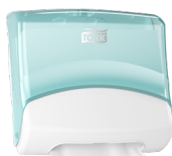
654000 Tork podajalnik za zložene brisače/krpe

Tork rešitve pomagajo izpolnjevati najstrožje higienске protokole za preprečevanje okužb in večjo varnost.