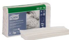
530178 Tork Heavy-Duty čistilna krpa

Kako vam še lahko pomagamo? Stopite v stik z nami, da se pogovorimo o vašem podjetju.