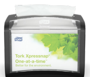
272611 Tork Xpressnap® podajalnik za serviete za mizo

Tork rešitve omogočajo dobro prakso zagotavljanja čistoče in priročno uporabo na območjih, kjer je veliko ljudi.