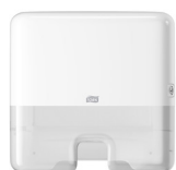
552100 Tork Xpress® mini dozator višestruko presavijenih ručnika za ruke

Tork sustavi koji su pristupačni za korisnike olakšavaju sprečavanje prijenosa bakterije, a poboljšavaju imidž i iskustvo.