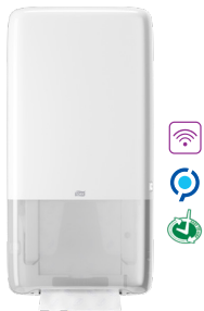
Tork PeakServe® Σύστημα Χειροπετσετών