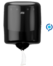
Σύστημα Tork Reflex™ centerfeed