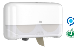
Tork OptiServe® Σύστημα για Χαρτί Υγιείας Χωρίς Μαδρέν