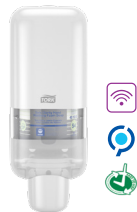
Tork Σύστημα για Σαπούνια και Αντισηπτικά