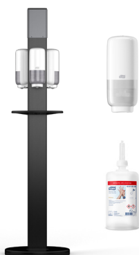
511055 Стойка Tork Hygiene Stand

Tork предлагает высококачественные картриджи для перезаправки и инновационные диспенсеры для создания безопасной и приятной атмосферы с целью повышения уровня удовлетворенности подопечных и посетителей.