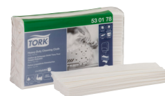
530178 Tork нетканый материал повышенной прочности белый