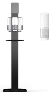
511055 Tork Hygiene Stand напольный диспенсер 571600 Tork автоматический диспенсер с ухаживающей пеной для рук

Tork предлагает высококачественные картриджи для перезаправки и инновационные диспенсеры для создания безопасной и приятной атмосферы с целью повышения уровня удовлетворенности пациентов и посетителей.