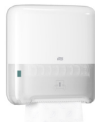
551000 Tork Matic диспенсер для полотенец в рулонах