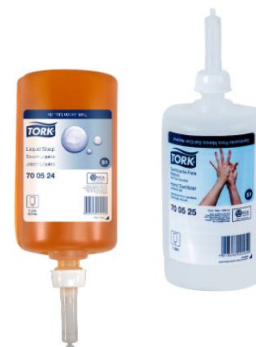
Tork® Jabón Líquido para Manos