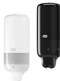
Tork® Dispensadores para jabón líquido y gel antibacterial