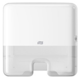
552100 Tork Xpress® Mini Dispenser per asciugamani intercalati

I pratici sistemi Tork facilitano la prevenzione delle contaminazioni crociate, migliorando al contempo l'esperienza degli utilizzatori e l'immagine della struttura.