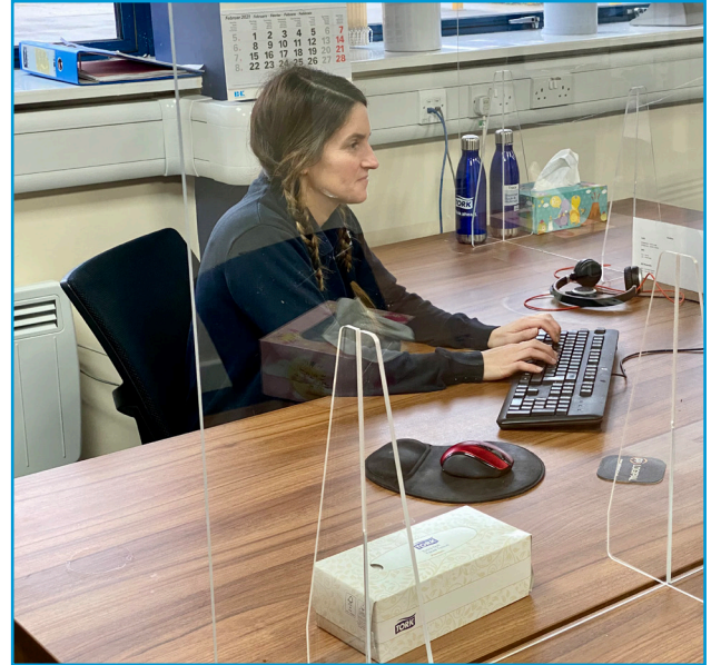
În cazul în care spațiile de lucru nu pot fi schimbate, luați în calcul montarea protecțiilor din plastic drept barieră suplimentară între angajați