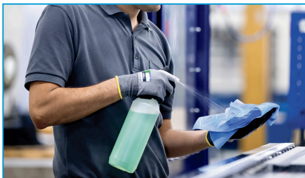
Alkoholio tirpalai su mažiausiai 70 % alkoholio veiksmingai dezinfekuoja ir valo paviršius.