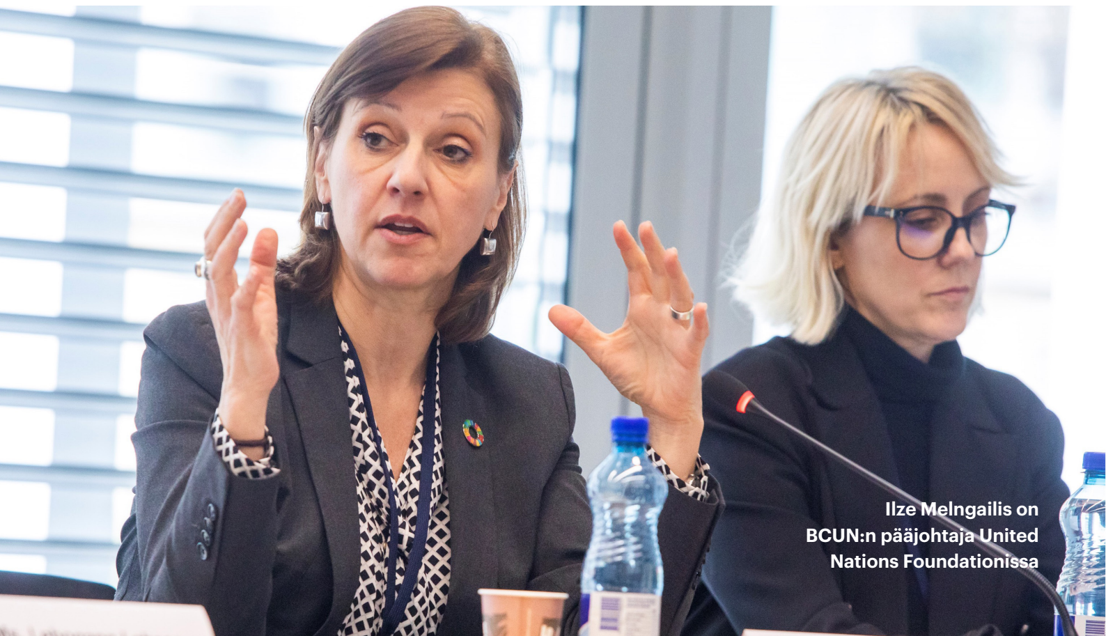
Ilze Melngailis on BCUN:n pääjohtaja United Nations Foundationissa

Keskustelut keskittyivät esimerkiksi käytösmallien muuttamiseen, teknisiin innovaatioihin ja investointien tukemisen tapoihin, ja osallistujat saivat tapaamisesta tärkeitä huomioita pohdittavaksi. Yhdessä määritettiin myös tavoitteita, joilla hoitoon liittyviä infektoita saataisiin vähennettyä ja infektioiden ehkäisyä ja torjuntaa edistettyä maailmanlaajuisesti. Nämä aiheet toimivat myös tämän yhteenvedon perustana.