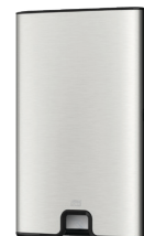
Tork Xpress® annostelija Multifold käsipyyhkelle H2