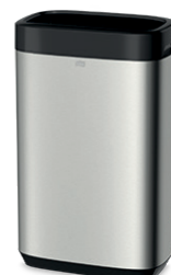
Tork roska-astia 50 l.