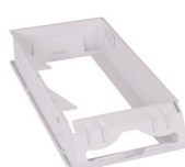
Tork Xpress™ keskikokoinen käsipyyhesovitin upotetulle kalusteelle