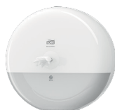
Tork SmartOne® annostelija wc-paperille T8