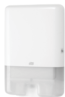
Tork Xpress® annostelija Multifold käsipyyhkelle H2