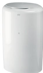
Tork roska-astia 50 l.