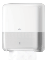
Tork Matic® annostelija rullakäsipyyhkelle H1