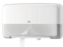
Tork Twin annostelija Mini Jumbo wc-paperille T2