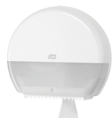
Tork annostelija Mini Jumbo wc-paperille T2