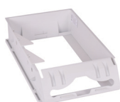
Tork Xpress™ suuri käsipyyhesovitin upotetulle kalusteelle