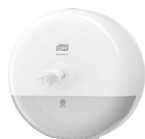
Tork SmartOne® Mini annostelija wc-paperille T9