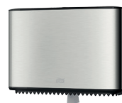
Tork annostelija Mini Jumbo wc-paperille T2