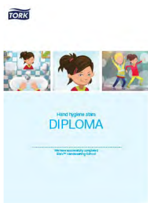
Diplom for håndhygienestjerner