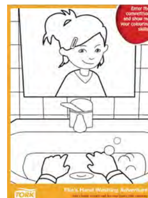
Plakat som kan fargelegges Ellas håndvask