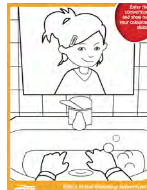
Ella kätepesu värvimisposter