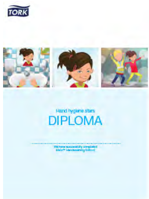
Kätehügieeni staaride diplom