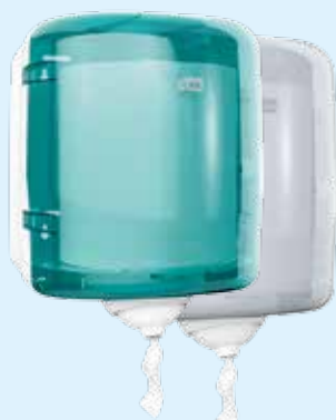
Диспенсер Tork Reflex™ с центральной вытяжкой (M4) Арт. 473180, Голубой Арт. 473190, Белый