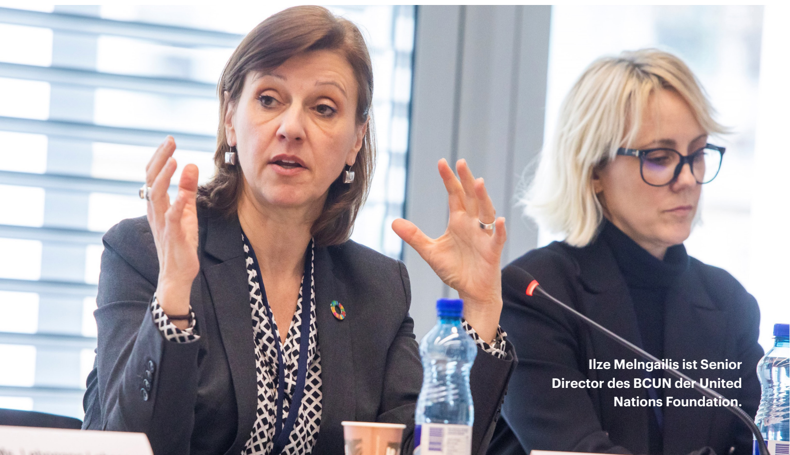
Ilze Melngailis ist Senior Director des BCUN der United Nations Foundation.

Wichtige Themen waren unter anderem Verhaltensänderungen, technische Innovationen und Möglichkeiten zum Vorantreiben von Investitionen. Zum Abschluss der Veranstaltung wurden die zentralen Erkenntnisse noch einmal zusammengefasst. Zudem wurden mögliche gemeinsame Ziele formuliert, die dazu beitragen können, das Auftreten von nosokomialen Infektionen zu verringern und die Infektionsprävention und -kontrolle zu verbessern. Diese Erkenntnisse sind die Grundlage der vorliegenden kurzen Zusammenfassung.