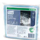
183600 183601, 183602, 183603 „Tork“ daugiartinės mikropluoštinės šluostės