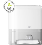
551100 „Tork Matic®“ popierinių rankšluosčių dozatorius su jutikliu „Intuition“