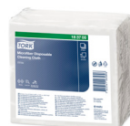
183700 Tork mikrokiud lapid, ühekordselt kasutatavad