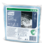
183600 183601, 183602, 183603 Tork mikrokiud lapid, kordvukasutatavad