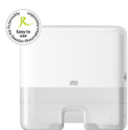
552100 Tork Xpress Multifold Mini