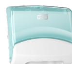
654000 Tork Performance lapijaotur