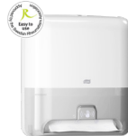
551100 Tork Matic® Dispensador para Toalha de Mãos com Sensor Intuition