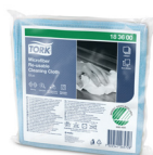
183600 183601, 183602, 183603 Tork Panos de Microfibras, Reutilizáveis