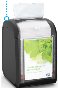
Tork Xpressnap Fit диспенсер настольный

Настольные диспенсеры Tork Xpressnap Fit в сочетании с расходными материалами Tork Xpressnap белого и натурального цвета позволят вашему предприятию повысить эффективность благодаря сокращению времени на заправку, а также поддержат гигиену для гостей.