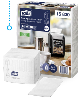
Система перезаправки Tork Xpressnap Fit

Донесите свою информацию с помощью функции AD-a-Glance® в виде настраиваемых информационных панелей: adaglance.torkglobal.com