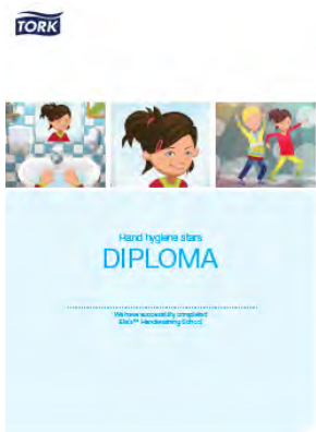
Diploma de las Estrellas de la higiene de manos