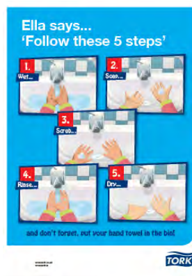
Póster de La aventura de Ella para lavarse las manos