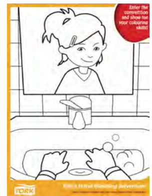
Póster para colorear de La aventura de Ella para lavarse las manos