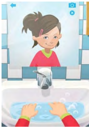
Aplicación La aventura de Ella para lavarse las manos