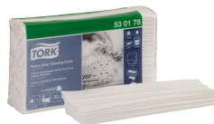
530178 Tork Aftøringsklud Kraftig

Vi hjælper dig gerne. Kontakt os og få en snak om din virksomhed.