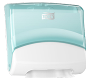
654000 Tork Top-Pak Dispenser

Tork løsninger supporterer de skrappeste hygiejneforskrifter og hjælper med at forebygge infektioner og skabe bedre sikkerhed.