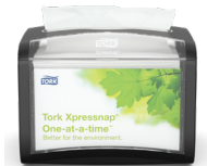
272611 Tork Xpressnap® Servietdispenser til bord

Tork løsninger sikrer best practises for hygiejne og komfort i disse travle fællesområder.