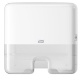
552100 Tork Xpress® Mini Dispenser Multifold Handduk

Förhindra korskontaminering och förbättra upplevelsen enkelt med de användarvänliga systemen från Tork.