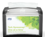
272611 Tork Xpressnap® Bordsdispenser

Tork säkerställer att bästa praxis för renlighet och komfort tillämpas på dessa populära samlingsplatser.